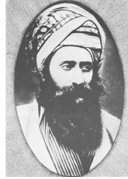
מרן הגאון הקדוש רבי יוסף חיים מבאגדאד זצ"ל בעל "בן איש חי"

רבי ישראל אבוהצירא זצ"ל (ה"בבא סאלי") – רבם ומאורם של בני עדות המערב – "השומר את זקנו כאילו שומר הברית. ואפילו לנגוע בו במספרים אסור. והיו מהמדקקים שלא לנגוע אפילו בשערות הזקן שמה תפול שעה אחת. וסיפר על עצמו שלא הי' לו זקן עד גיל 40 שנה והתפלל ובכה שיגדל זקנו. ותוך שבוע החל גודל זקנו לצמוח. "בנוסף התבטא בחריפות כנגד כל מי שנוגע בזקנו, אפילו רבנים מובהקים" (נרשם ע"י חתנו נ"י, ה'תשל"ח – נדפס בס' הדרס פנים-זקן [מהד"ת] עמ' 41).