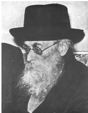
מרן החזון איש ז"ל